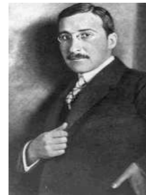
Stefan Zweig 1881-1942

négation absolue de ses idéaux. Pourtant à Paris il n'est pas isolé. Les relations tissées dans le cadre de son activité professionnelle à Leipzig lui permettent de trouver quelques