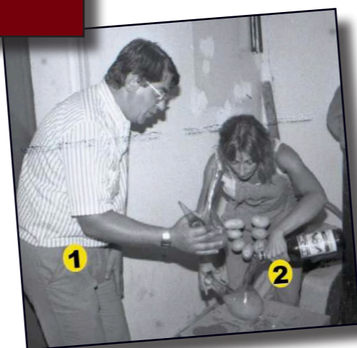
1. Guiraute, 2. Lacaste, préparation du Pojon