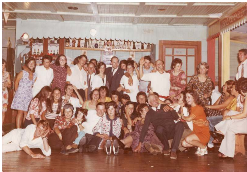
Une soirée à l'Edelweiss

Association loi 1901 64490 ACCOUS memoiredaspe@free.fr ISSN : 1777-7194