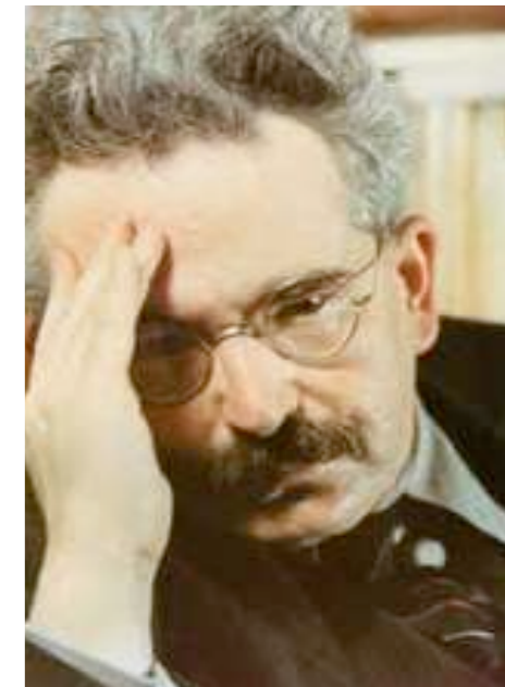
Walter Benjamin 1892-1940

en Espagne, y être interné un certain temps et aller jusqu'à Lisbonne pour ensuite gagner New-York. Le 10 décembre il revient à Bedous vers 19 heures par le train de Pau. Comme il le fait habituellement, il descend du wagon un peu avant la