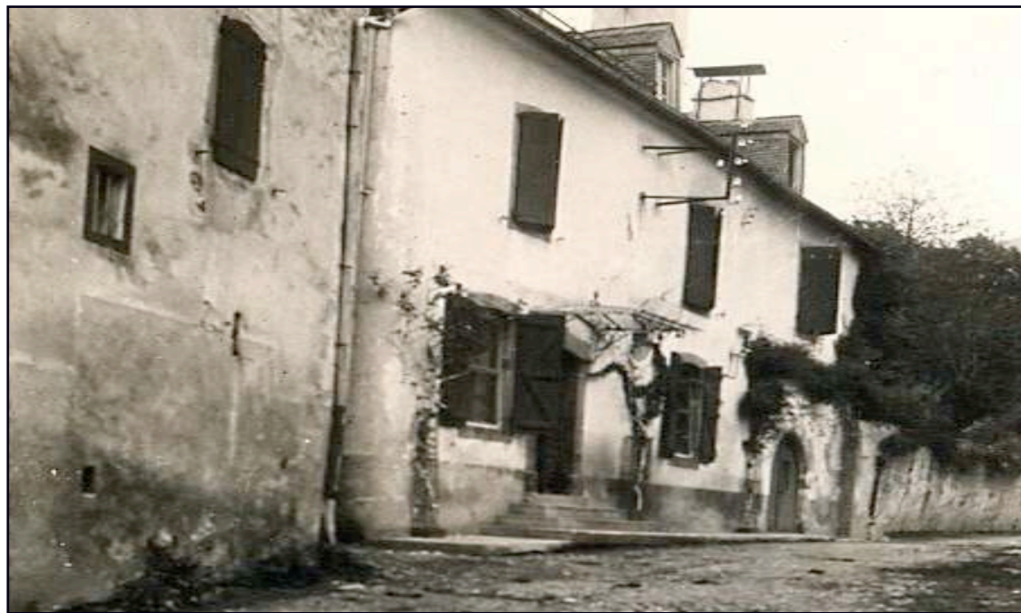
La maison Cavendish en 1959