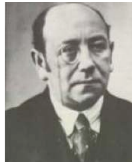
Carl Einstein 1885-1940